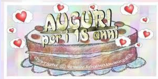
1. Il diciottesimo compleanno