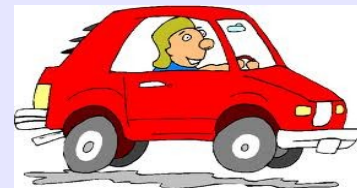
8. L'acquisto della prima auto