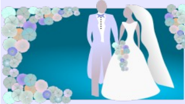
4. Il matrimonio