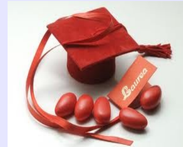
3. Il giorno della Laurea

Quale è stato un giorno importante della tua vita? Cosa è successo?