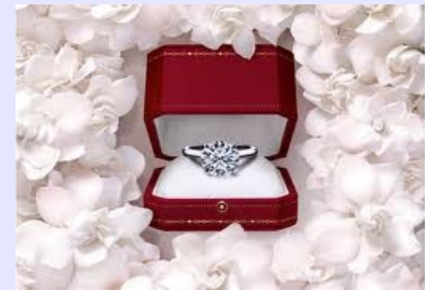
6. L'anello di fidanzamento