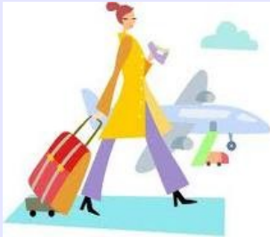
2. Un viaggio

Quale è stato un giorno importante della tua vita? Cosa è successo?