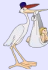
5. La nascita di un bambino