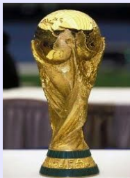
7. La vincita della Coppa del Mondo